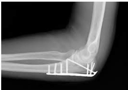
shafa Hospital of saghez

۶- در صورت تجویز فیزیوتراپی جهت بازگشت حرکت عضو شکسته، به فیزیوتراپ مراجعه کنید.